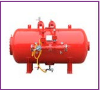
Premescolatore a spostamento di liquido Foam bladder tanks