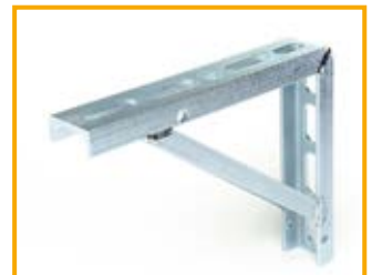
Mensola a squadra S Support bracket S