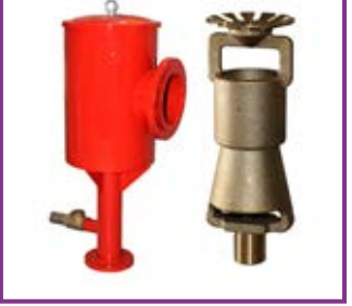
Generatore schiuma a bassa pressione Low expansion foam