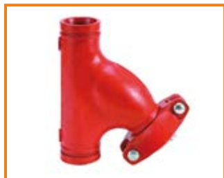
Filtro a Y mod. FY Y filter mod. FY