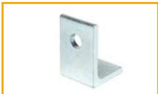
Sostegno angolare S Fixing bracket S