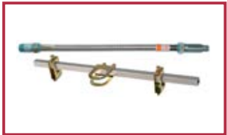
Tubo flessibile per sprinkler 1" x 1/2" Flexible hose 1" x 1/2"