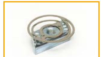
Dado a martello HZ1 con molla piatta Channel nut HZ1 with plane spring