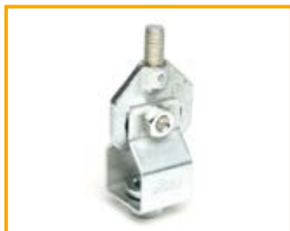
Snodo scorrevole J Slide element J