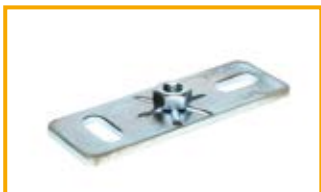
Piastra di base Stabil Mounting plate Stabil