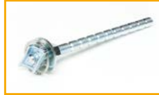
Vite a martello CC27 Blockset CC27