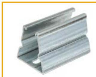
Profilato S 75/75 Channel S 75/75