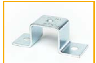
Sostegni SH per profilati 41 Channel bracket SH 41