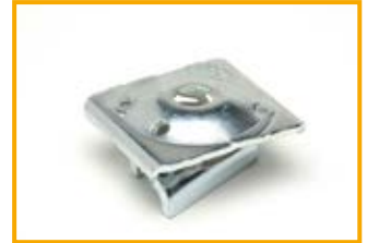
Blocco a pressione PBH41 Block PBH41