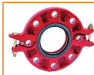
Adattatore a flangia mod. 7012 PN16 da 2" a 12" Flange adapter mod. 7012 PN16 from 2" to 12"