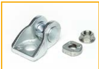
Angolare universale UG Universal joint UG