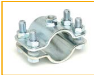
Collare per punto fisso da 1/2" a 20" Pipe clamp for fix point 1/2" to 20"