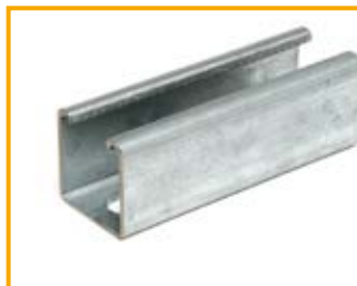
Profilato S 41 Channel S 41