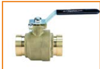
Valvola a sfera scanalata con leva mod. VSS da 2" a 12" Ball grooved valve with lever mod. VSS from 2" to 12"