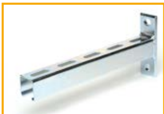
Mensola a sbalzo 41/41 Cantilever bracket 41/41