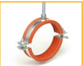
Stabil D-3G con gomma silicone da 3/8" a 20" Stabil D-3G with silicone lining from 3/8" to 20"