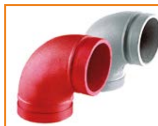
Curva a 90° mod. 90 da 1" a 12" 90° elbow mod. 90 from 1" to 12"