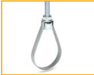
Collare sprinkler da 1" a 8" Pipe clamp sprinkler from 1" to 8"