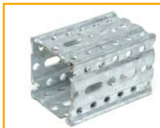
Profilo Framo Channel Framo F80