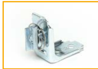
Piastra angolare CC41 Angle connector CC41