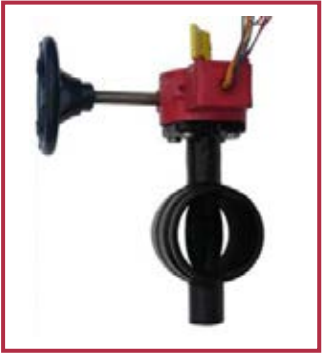
Valvola a farfalla VSVS con switch Butterfly grooved valve mod. VSVS with switch