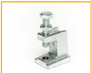
Morsetto TCS Beam clamp TCS