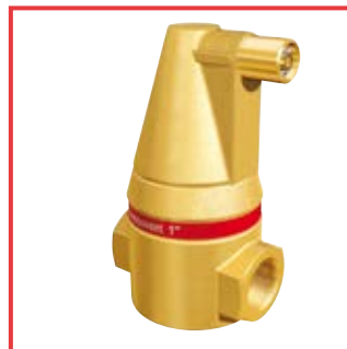
Flamcovent® con isolamento Eco-Plus da 22 mm a 2" Flamcovent® Eco-Plus with insulation from 22 to 2"