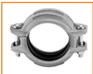
Giunti e raccordi scanalati INOX Grooved coupling and fittings