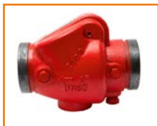
Valvola di Ritegno VR Check Valve