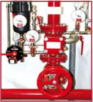
Stazione a secco TAV Dry station TAV