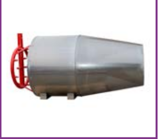
Generatore schiuma ad alta espansione Hi-Ex Foam generator