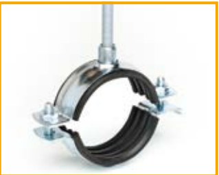
Stabil D-3G con gomma da 3/8" a 20" Stabil D-3G with lining from 3/8" to 20"