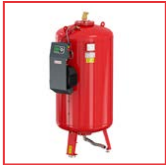
Flexcon® M-KU da 400 a 3500 lt, 6 e 10 bar Flexcon® M-KU from 400 to 3500 lt, 6 and 10 bar