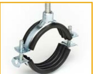
Ratio S2000 con gomma da 1/4" a 6" Ratio S2000 with lining from 1/4" to 6"