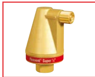
Flexvent® Super da 1/2" e 3/4" Flexvent® Super, 1/2" and 3/4"