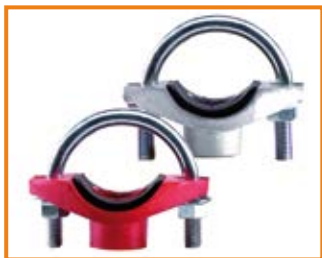
Derivazione a staffa filettata mod. 720FL da 1" 1/4 a 2" 1/2 Threaded branch outlet mod. 720FL from 1" 1/4 to 2" 1/2