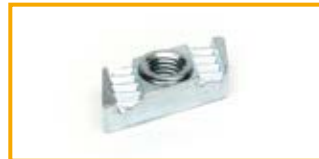
Dado a martello HZ1 Channel nut HZ1