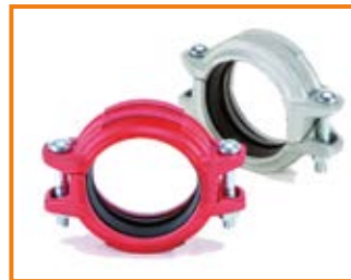
Giunto rigido mod. R270 da 1" a 12" Rigid coupling mod. R270 from 1" to 12"