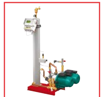
Ena, disaerazione e rabbocco automatico Ena, automatic deaeration and make-up