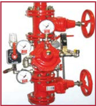
Stazione a diluvio FSX ad attuazione elettrica Deluge station FSX with electric actuation