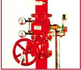
Stazione ad umido NAV Wet station NAV