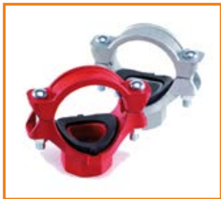
Derivazione a staffa filettata mod. 720F da 2" a 6" Threaded branch outlet mod. 720F from 2" to 6"