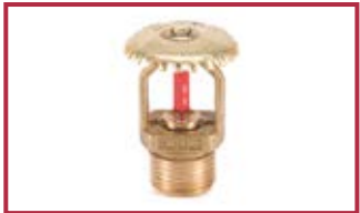
Sprinkler upright da 1/2" e 3/4" Sprinkler upright, 1/2" and 3/4"