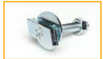
Vite a martello HZ1 T-head bolt HZ1