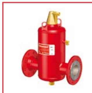
Flamcovent® da DN 50 a DN 600 Flamcovent® from DN 50 to DN 600