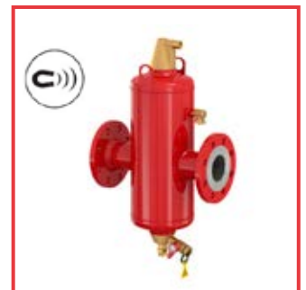
Flamcovent® Clean Smart da DN 50 a DN 600 Flamcovent® Clean Smart from DN 50 to DN 600