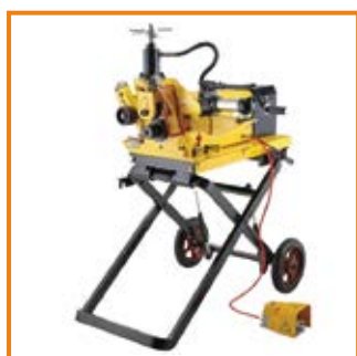
Rullatrice automatica Roll grooving machine