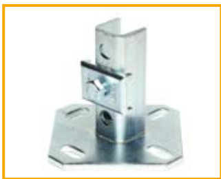
Piastra WBD End support WBD