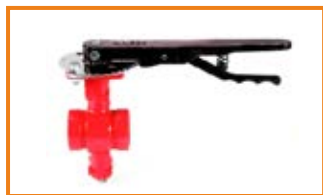
Valvola a farfalla VSL scanalata con leva di manovra da 2" a 12" Butterfly grooved valve with lever mod. VSL from 2" to 12"