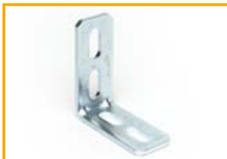
Angolare MW Fixing bracket MW