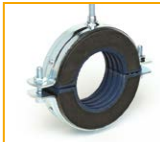
Collare alta coibentazione SKS Top-2C da 3/4" a 10" Refrigeration pipe clamp SKS Top-2C from 3/4" to 10"