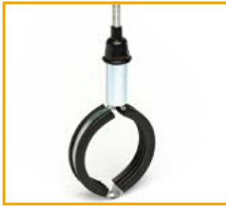
Collare BKI da 3/8" a 16" Pipe clamp BKI from 3/8" to 16"