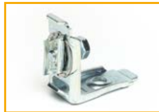
Piastra angolare CC27 Angle connector CC27