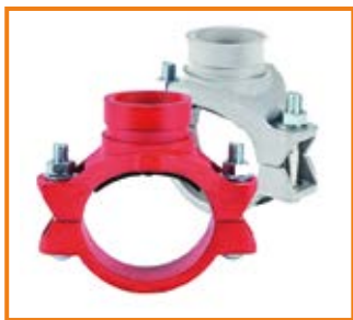
Derivazione a staffa scanalata mod. 720S da 2" a 8" Grooved branch outlet mod. 720S from 2" to 8"