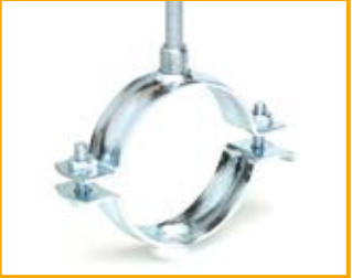
Stabil D-3G da 3/8" a 20" Stabil D-3G from 3/8" to 20"