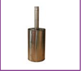
Generatore schiuma a media espansione Medium expansion foam