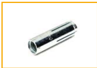
Ancorante a cono interno EA Drop-in anchor EA