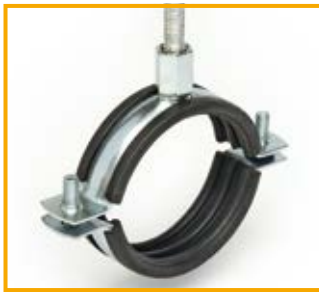
Pratik Duo con gomma da 1/4" a 8" Pratik Duo with lining from 1/4" to 8"