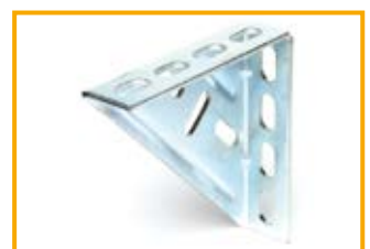
Mensola a squadra M Support bracket M