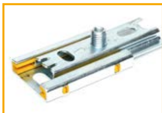
Slitta di scorrimento 1-2G Slide set 1-2G