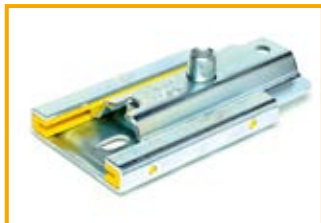
Slitta di scorrimento H3G Slide set H3G