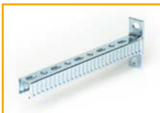
Mensola a sbalzo 27/27 Cantilever bracket 27/27