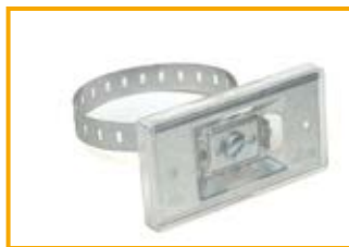
Targhetta universale con reggetta Universal holder with strap