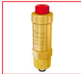
Flexvent® da 3/8" e 1/2" Flexvent®, 3/8" and 1/2"