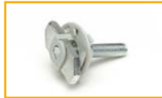
Clickeasy HBS Clickeasy HBS