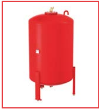
Flamcomat FG da 150 a 10000 lt Flamcomat FG from 150 to 10000 liters