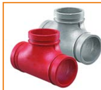
Raccordo a T mod. 130 da 1" a 12" Tee fitting mod. 130 from 1" to 12"