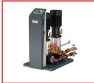
Dispositivo a doppia pompa per vasi di espansione automatici Double pump device for automatic expansion vessels