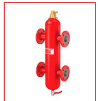
Flexbalance® Plus da DN 50 a DN 400 Flexbalance® Plus from DN 50 to DN 400