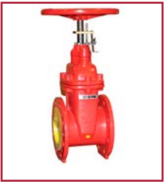
Saracinesca VdS (dal DN 50 al DN 200) Gate valve VdS (from NB 50 to NB 200)