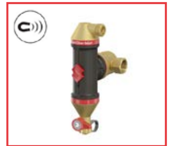
Flamcovent® Clean Smart da 22 mm a 2" Flamcovent® Clean Smart from 22 mm to 2"