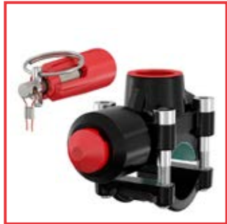
T-Plus per tubi di acciaio da 1/2" a 3" con detonatore T-Plus for steel pipes from 1/2" to 3" with trigger